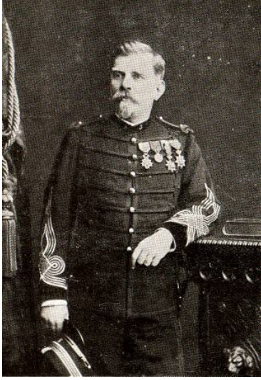
Joseph Joffre en 1889