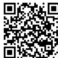
Video choc des savoirs